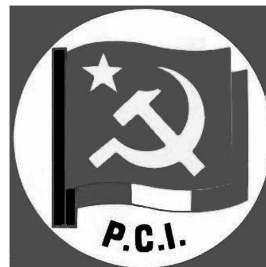
Falce e martello, il simbolo del Partito Comunista Italiano (PCI).

Indizi sì ma non prove. Ach'io sono stato licenziato una volta causa una segnalazione della polizia. Che lavorassero assieme, in particolar modo con la direzione delle grandi fabbriche era per noi una cosa ovvia.