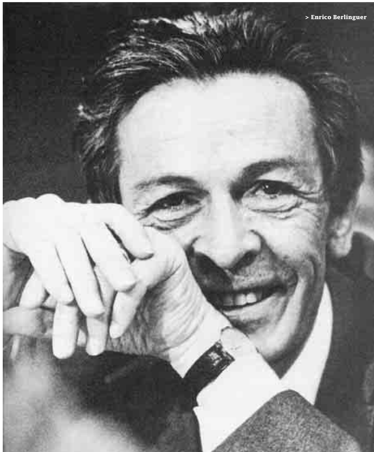
> Enrico Berlinguer

Berlinguer attacca gli errori enormi compiuti nella politica del suolo, del territorio, dell'ambiente, nel campo della ricerca. La svolta che egli propone «non è un mero strumento di politica economica cui si debba riconferire per superare una difficoltà temporanea, congiunturale, per potere consentire la ripresa e il ripristino dei vecchi meccanismi economici e sociali». La proposta che egli avanza è rivolta a «contrastare alle radici e a porre le basi del superamento di un sistema che è entrato in una crisi strutturale, i cui caratteri distintivi sono lo spreco e lo sperpero, l'esaltazione dei particolarismi e dell'individualismo più sfrenati, del consumismo più dissennato. [...] La nostra proposta è il contrario di tut-